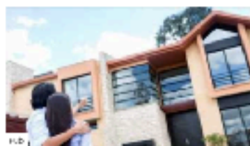
Avec un volume de 32006, le bâtiment le...